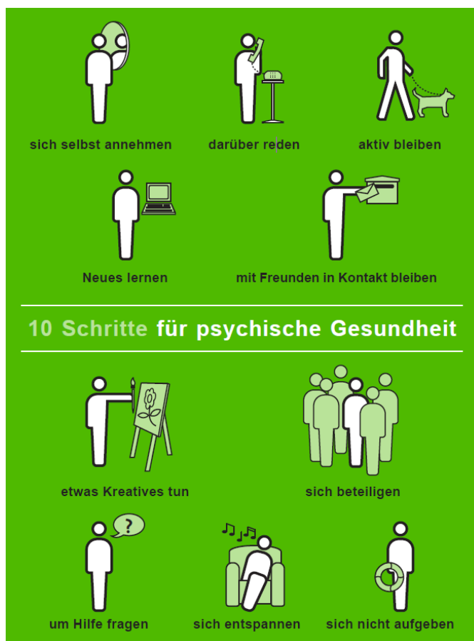
Abb. 1: Die «10 Schritte für psychische Gesundheit».

Die «10 Schritte für psychische Gesundheit» wurden aus der Perspektive der Positiven Psychologie als wissenschaftlich sinnvoll beurteilt [22]. Alle 10 Schritte hängen gemäß den Autoren positiv mit gesundheitsbezogenen Variablen zusammen. Ohne direkten Bezug zu den «10 Schritten für psychische Gesundheit» hat die gleiche Forschungsgruppe aufgezeigt, dass Charakterstärken 1 und Gesundheitsverhalten wesentlich mit physischer und psychischer Gesundheit zusammenhängen [19]. Verhaltensweisen, die als «aktive Lebensführung» zusammengefasst werden, zeigten den