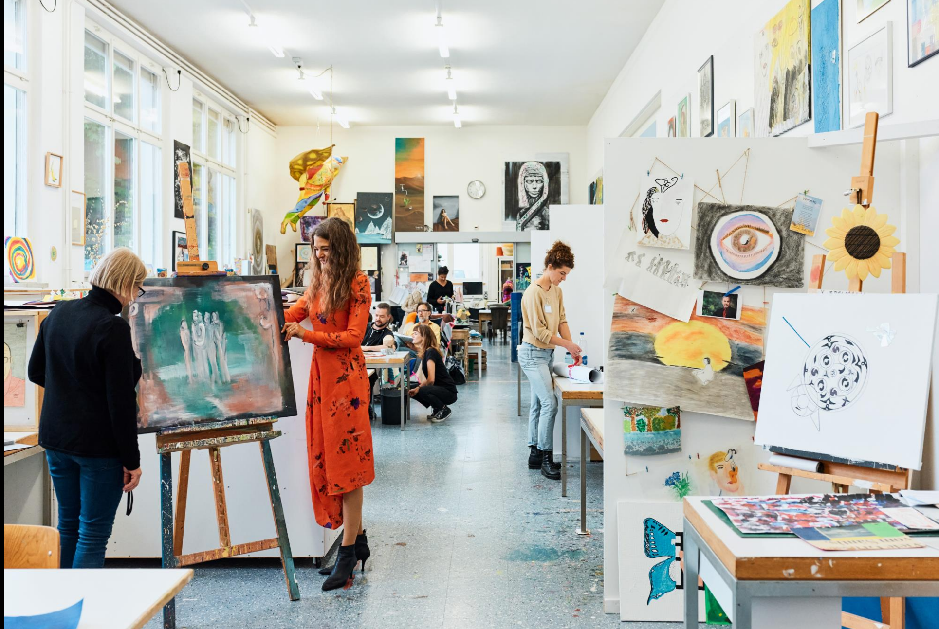
1. Living Museum New York, 1983, 2. Living Museum, 2002: Living Museum Wil SG