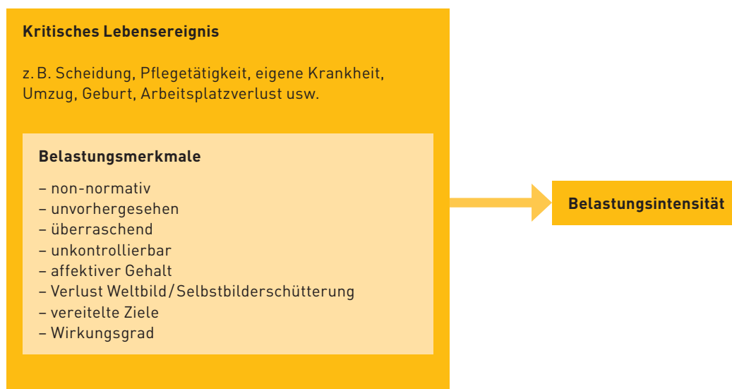
Abbildung 1: Belastungsmerkmale kritischer Lebensereignisse