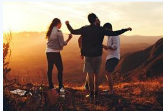
Droits de l'enfant