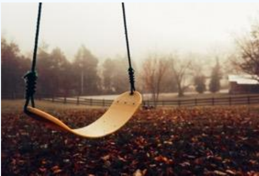
Traite de mineur-e-s en Suisse