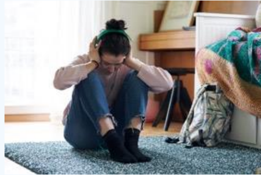
Enfants exposés à la violence domestique