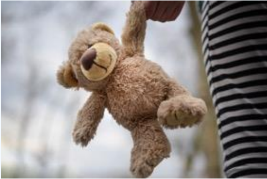
Violence dans l'éducation